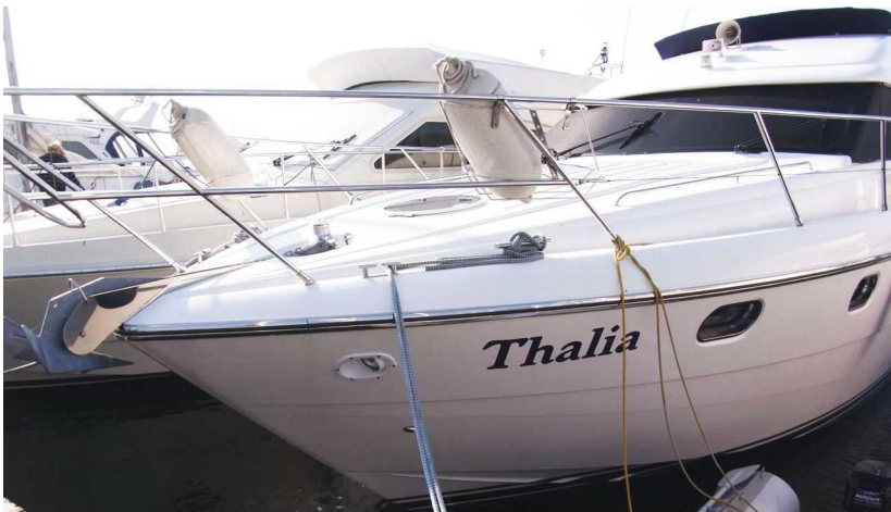
Grömitz September 2012 – Einen Dank an Kirsti und Klaus Fischer