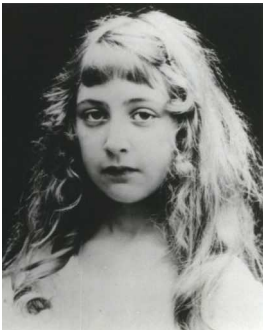
Agatha als Kind

Dame Agatha Mary Clarissa Christie, Lady Mallowan gebürtig Agatha Mary Clarissa Miller